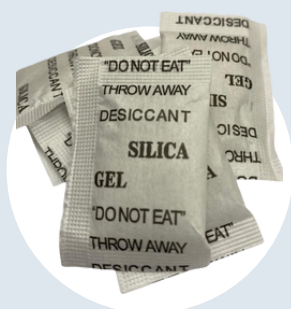
[0031] Silica gel 1gr