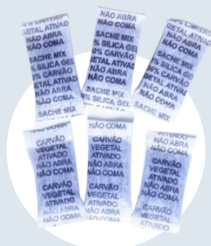
[0032] Silica carvão ativado 1gr