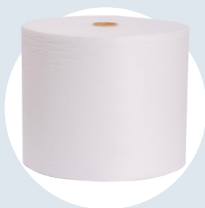
[0033] Pano multiuso (240mx28cm - picote de 40cm) cor branca